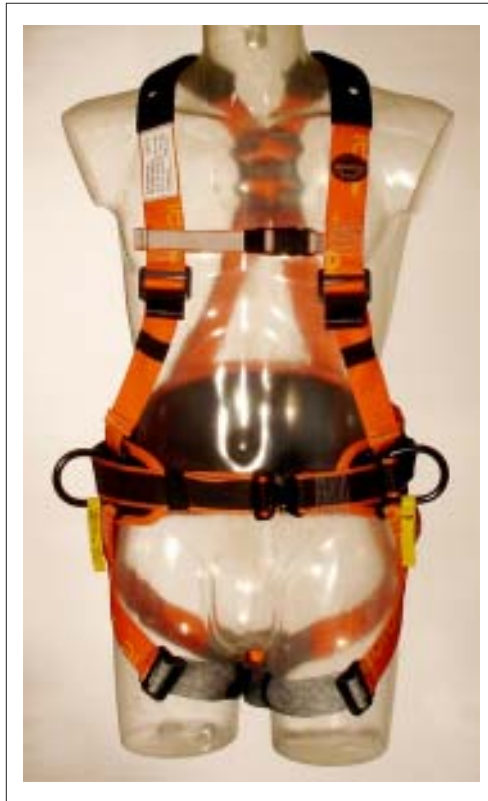
NIERENSCHUTZPOLSTER PADDED KIDNEY PROTECTOR