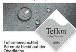
Teflon-beschichtet: Schmutz bleibt auf der Oberfläche

Zulassung: EN 361 + EN 1497 + ON F 4040 geprüft/ CE 0408