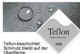
Teflon-beschichtet: Schmutz bleibt auf der Oberfläche

Design like Work pos. + Restraint belt KS 45 with additional comfort equipment: