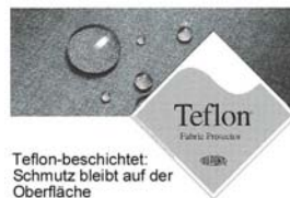
Teflon-beschichtet: Schmutz bleibt auf der Oberfläche